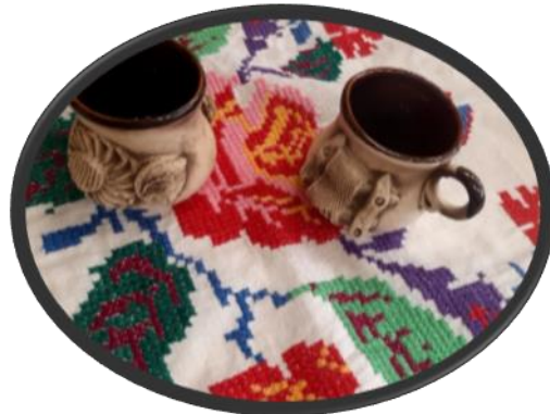
«Посуда из глины»