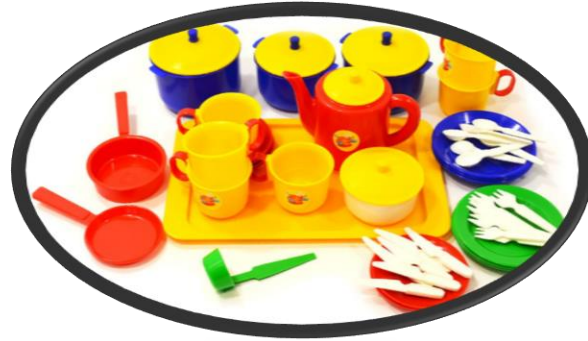
«Посуда из пластмассы»