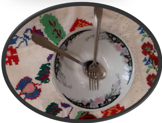
«Посуда из стекла»