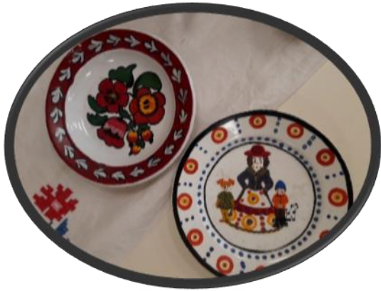
«Посуда из камня»